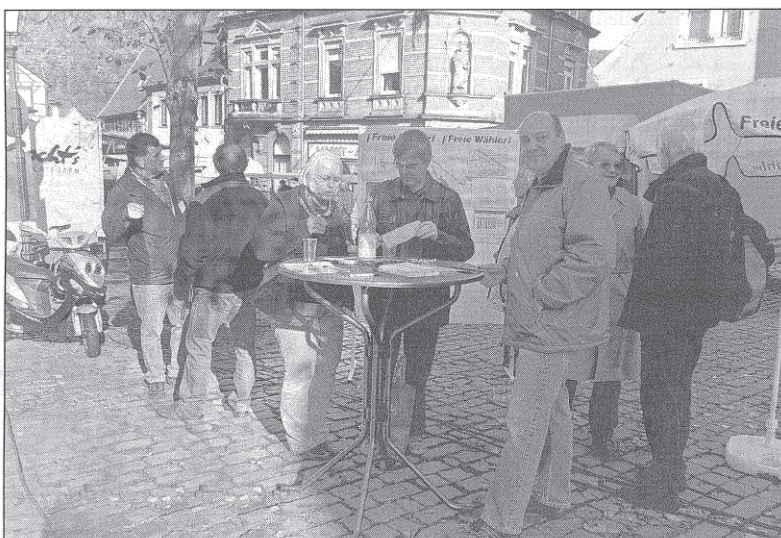
Im Gespräch mit den Bürgern zum Thema Hollmuthstunnel waren die freien Wähler auf dem Marktplatz

Auf Seite 16 in dieser Ausgabe gibt es außerdem einen Bericht über den neuen Banner des Gewerbevereins, der nun beim Hollmuthstunnel zu finden ist. Im Beihefter zum Bohrermarkt sprach die Redaktion zudem mit Bürgermeister Althoff unter anderem über die noch ausstehenden Verbesserungen des Verkehrskonzeptes.